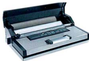
Vano con coperchio per rotolo/ sacchetti per confezionare sottovuoto.

FreshQuality SV 400 permette di confezionare sottovuoto qualsiasi tipo di alimento proteggendolo dalle insidie dell'aria e preservandone in questo modo la freschezza e la qualità per un periodo superiore (fino a 5 volte) rispetto alla normale conservazione. I cibi di ogni tipo, tranne quelli liquidi, possono facilmente essere confezionati sottovuoto in appositi sacchetti (realizzabili anche con il rotolo in dotazione). Per confezionare gli alimenti non solidi o quelli particolarmente delicati, utilizzare appositi contenitori (disponibili in commercio) collegandoli a FreshQuality SV 400 tramite il tubetto in gomma completo di raccordi.