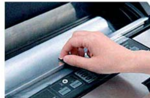
Barra di scorrimento e taglierina per realizzare il sacchetto della lunghezza desiderata.