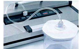
Tubetto flessibile in gomma completo di raccordi per confezionare sottovuoto gli alimenti non solidi. Non sono inclusi nella confezione gli appositi contenitori, vasetti con coperchio e bottiglie con apposito tappo.