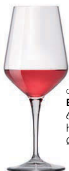
Cod. BR.92342 65 cl h 24 mm Ø 10,2 mm

Il design moderno è ideale per un'apparecchiatura elegante e contemporanea e la particolare forma a doppio cono contrapposto assicura una corretta ossigenazione dei vini ed un coerente sviluppo delle componenti olfattive. Le caratteristiche tecniche di Electra rispondono alle più precise esigenze di funzionalità e praticità: l'innovativo materiale Star Glass offre brillantezza e neutralità del colore del vetro e l'esclusivo trattamento XLT, inalterabile nel tempo, garantisce elevate prestazioni in termini di resistenza all'uso, agli urti e ai lavaggi in lavastoviglie industriale.