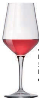
Cod. BR.92352 55 cl h 23 mm Ø 9,5 mm